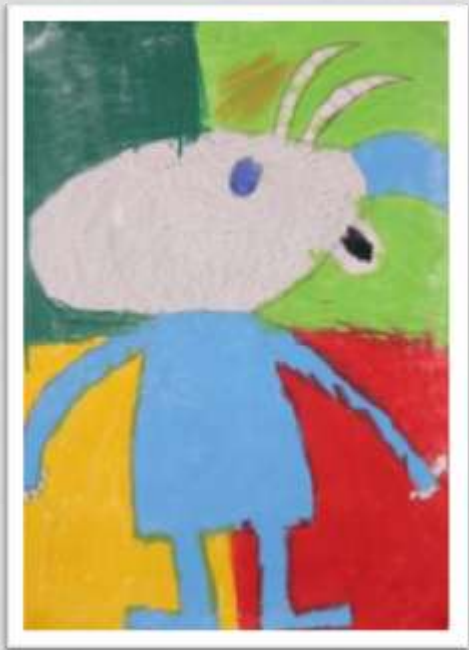
Tatu T. 1B