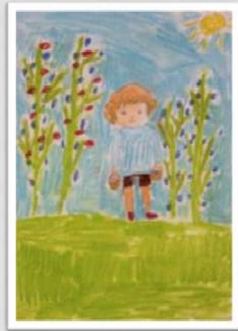
Essi I. 4-5B