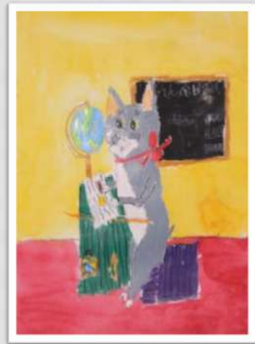
Minja T. 3B