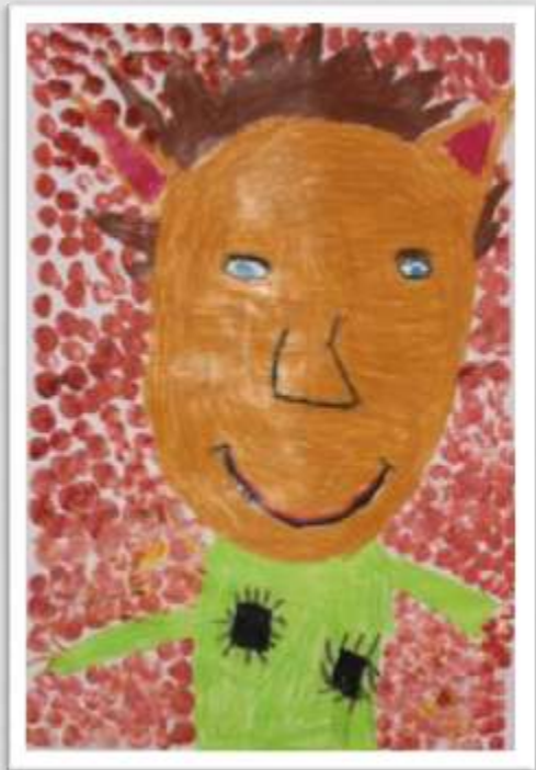
Joa V. 1-2C